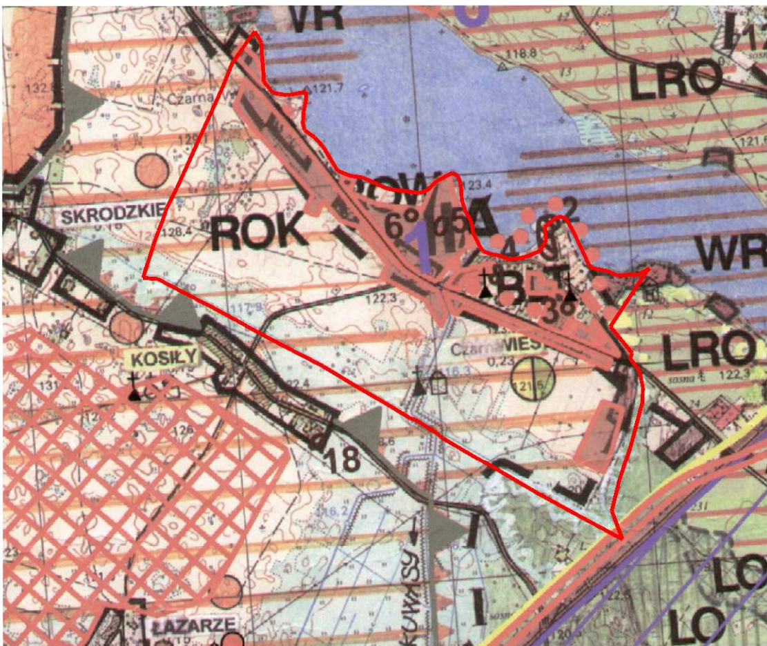
GRANICA OPRACOWANIA PLANU